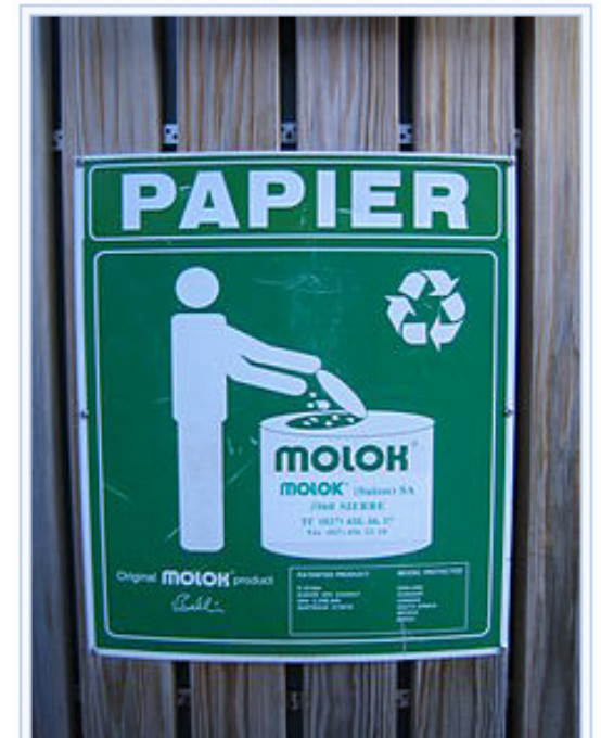
Het afval uit deze afvalbak voor papier wordt gerecycled, dat is te zien aan het symbool op de bak