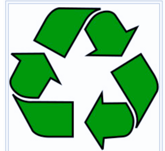
Internationaal symbool van recycling

Het gemiddelde recyclepercentage in de EU lag in 2013 op 39%, [4] en groeide naar 45% in 2015. [5]