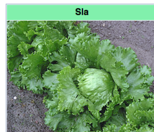
Ijsbergsla ( Lactuca sativa )