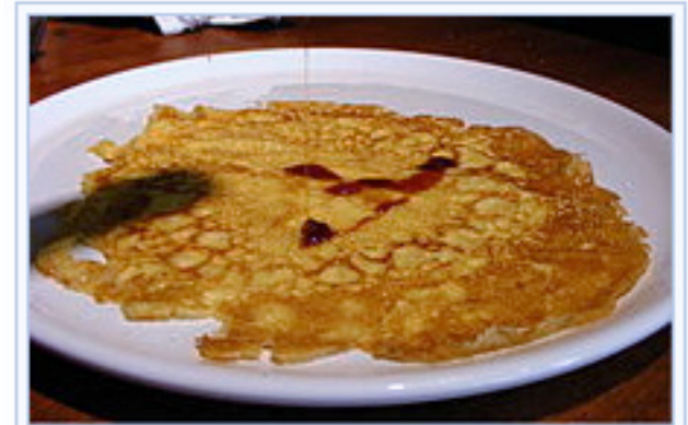
Klassieke pannenkoek met stroop