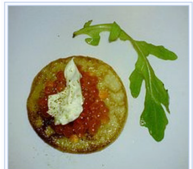
Blini met kuit